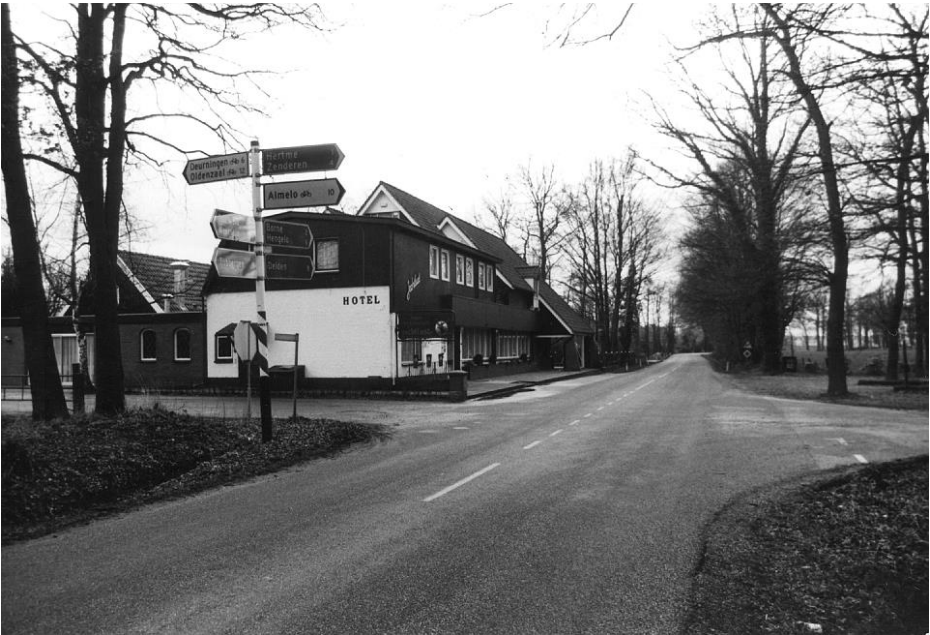
Hotel Jachtlust voor de omlegging van de Weerselosestraat en zonder de onlangs aangebouwde serre