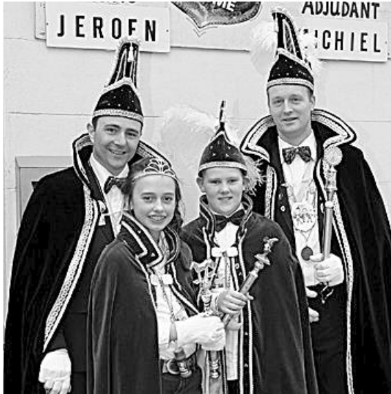
Uit de oude doos: Carnaval 2014